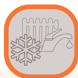
Antigelo Riscaldamento e Sanitario