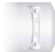
Staffa di montaggio