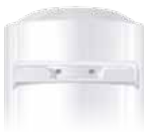
Staffa di montaggio universale