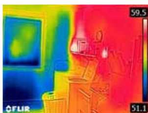
Parete esterna non isolata