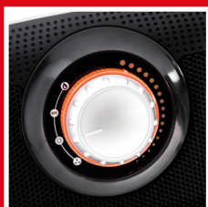
Manopola comandi Control knob