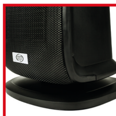
Base oscillante Swinging base