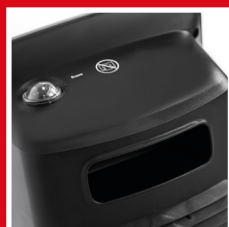
Maniglia e tasto di oscillazione con protezione per l'acqua Handle and swivel button with water protection