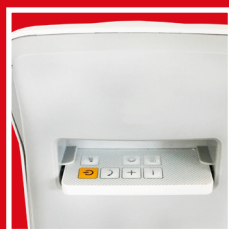
Pratica maniglia posteriore e vano porta telecomando Practical rear carry handle and compartment for remote control