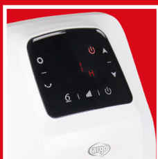
Display digitale e comandi soft touch Digital display and soft touch buttons

It's the ideal solution for total comfort in the bathroom area. Well-being and safety are guaranteed by IP21 protection against splashes of water. It has ergonomic lines that include the handle and the front soft touch LED display, that allows easy programming.