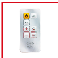
Telecomando slim utilizzabile fino a 6m di distanza Slim remote control for use up to 6m